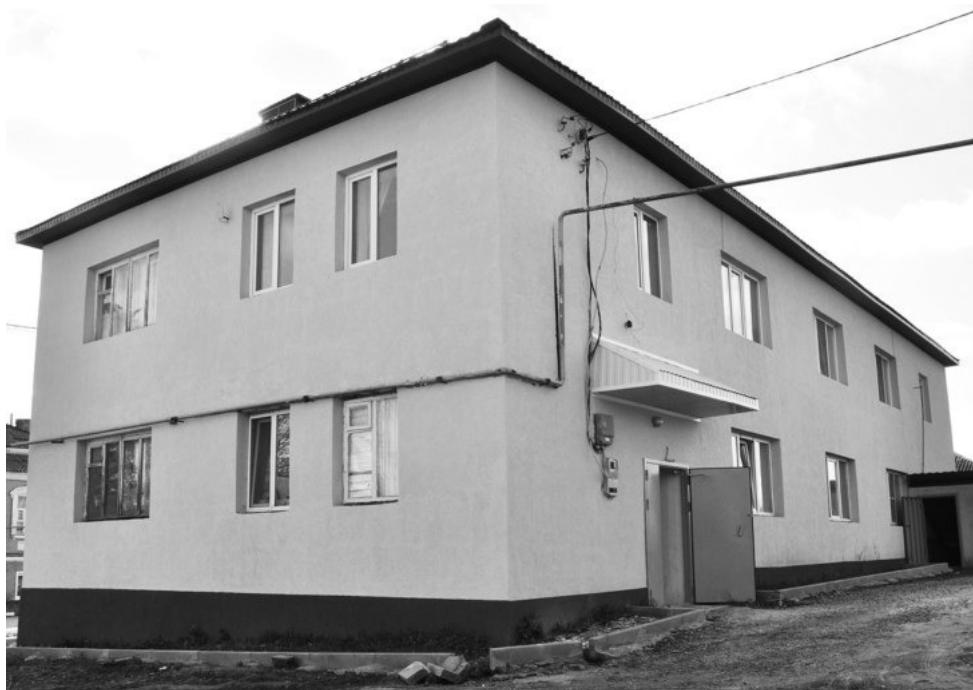
Дом № 10 по улице Вознесенской в городе Бирюч был сдан в эксплуатацию в 1971 году. Долгое время в нём размещалось общежитие, а впоследствии он получил статус многоквартирного.

За 50 с лишним лет своего существования двухэтажное здание поддерживалось в удовлетворительном состоянии за счёт косметических ремонтов. А проживающие в нём люди, соответственно, требовали большего, заявляя о своих намерениях в различные инстанции.