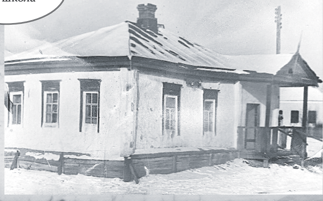
Церковноприход- ская школа

ВЕРХНЕПОКРОВСКАЯ СРЕДНЯЯ ШКОЛА ОТМЕТИТ В ТЕКУЩЕМ ГОДУ 120-ЛЕТНИЙ ЮБИЛЕЙ