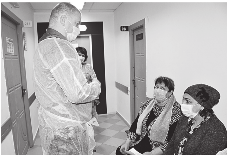
В центральной районной больнице