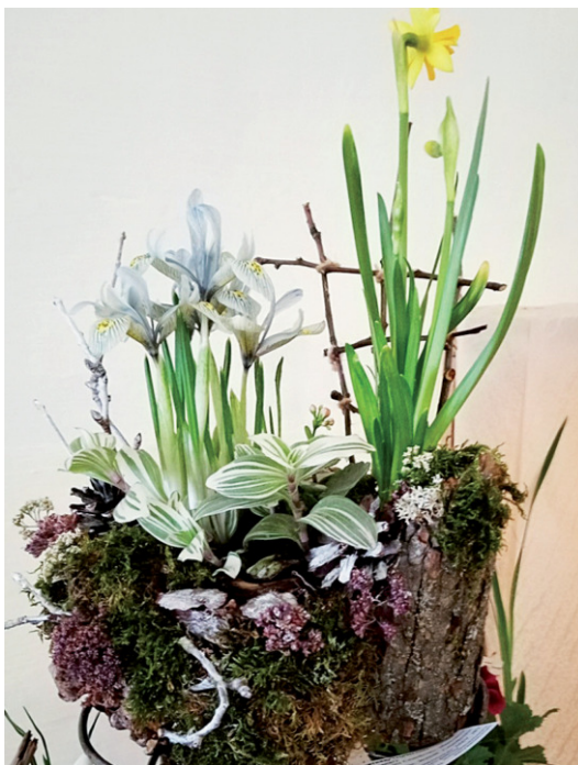
13 учреждений образования приняли участие в районной выставке растений. Она традиционно начала свою работу на базе Станции юннатов.

Ежегодная выставка выгоночных цветочно-декоративных растений «Приближая дыхание весны...» открылась на базе Станции юных натуралистов. Её главные задачи – активизация деятельности образовательных учреждений по организации опытнической работы в области цветоводства, воспитание у детей и подростков экологической культуры.