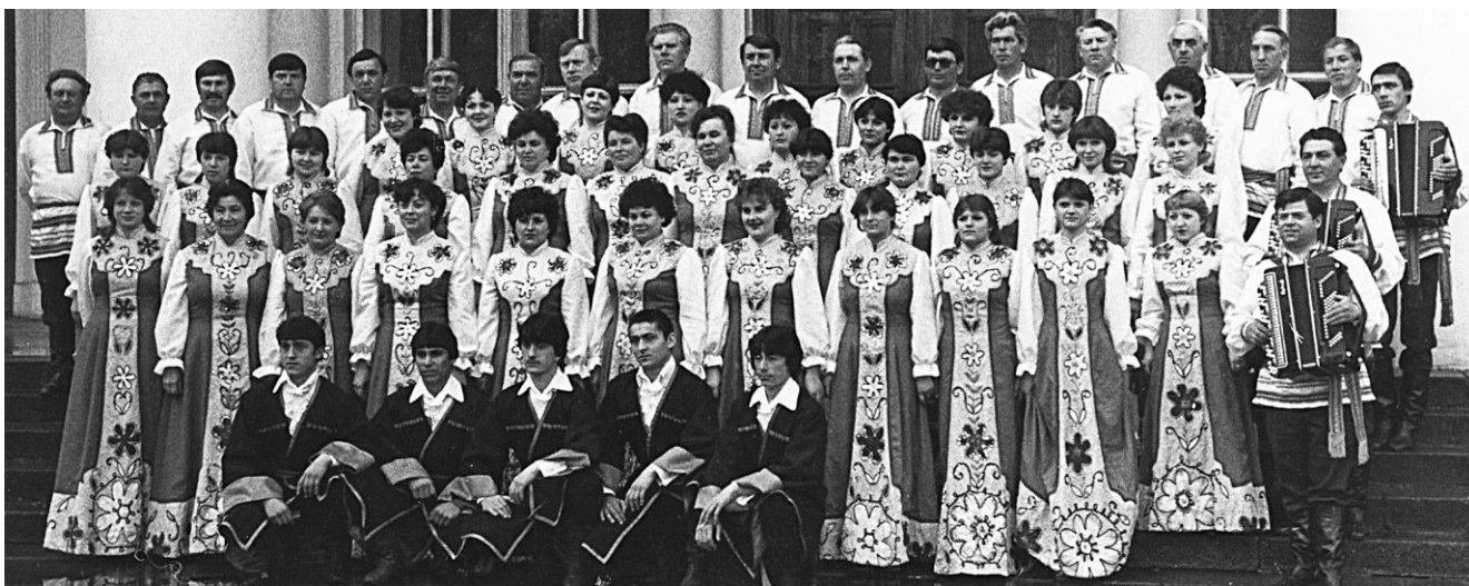
Выступление хора техникума на ВДНХ в Москве, семидесятые годы 20-го века