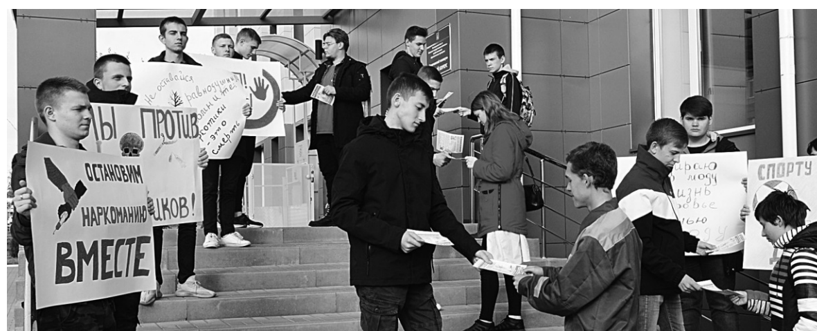
Проведение акции «Нет – наркотикам»

Обучающиеся в нашем техникуме не остаются безразличными к общественной жизни города и района. Они участвовали в незабываемом красочном мероприятии «Бирючанская ярмарка», интеллектуальной игре «Брейн-ринг», лиге КВН, молодёжном конкурсе разговорного жанра «Время, как звезды, сердца зажечь», фе-