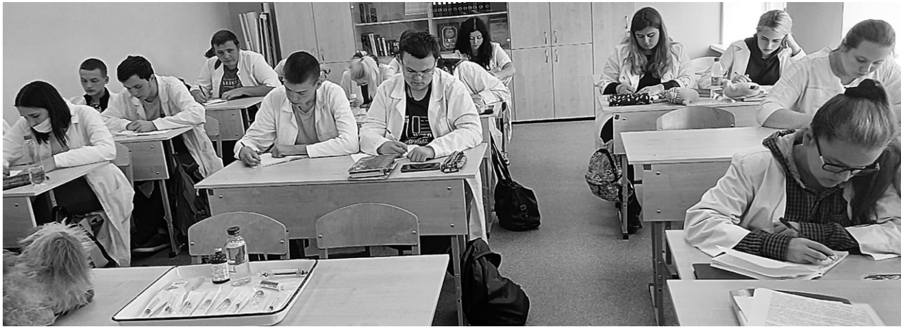
Практические занятия у второкурсников ветеринарного отделения