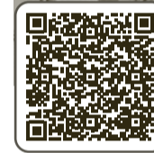
ОЛЬГА МУРДАСОВА