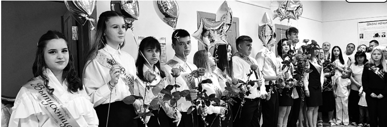
В школах Красногвардейского района завершился 2024 – 2025 учебный год. Последний звонок прозвенел для 3234 учеников.

Особенно волнительным это событие стало для обучающихся выпускных классов. В нынешнем году одиннадцатиклассников в нашем муниципалитете насчитывается 94 человека, мальчишек и девчонок, оканчивающих девятые классы значительно больше – 356. Получение профессии в Бирючанском техникуме завершают 144 выпускника. Торжественные линейки состоялись во всех образовательных учреждениях района. В связи со сложившейся на территории нашего региона оперативной обстановкой они проходили с соблюдением всех необходимых мер безопасности.