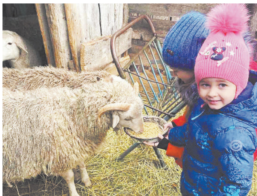
«Весёлые овечки», Дарья Кожухова