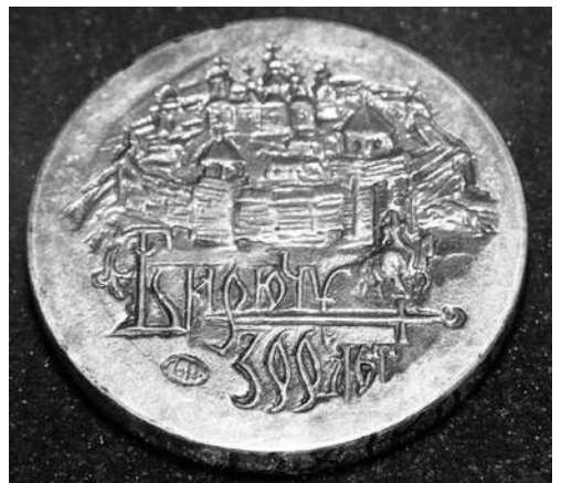
Медаль в честь 300-летия г. Бирюч, 2005 г.