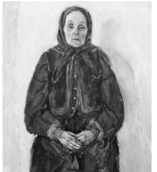
«Тётка Олеся», 1980 г.