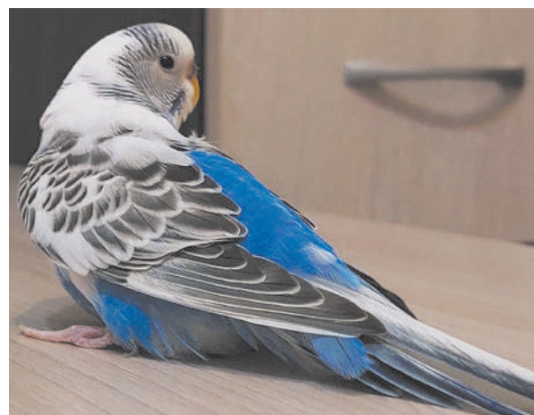
«Попугай Даша», Евгения Зацепина