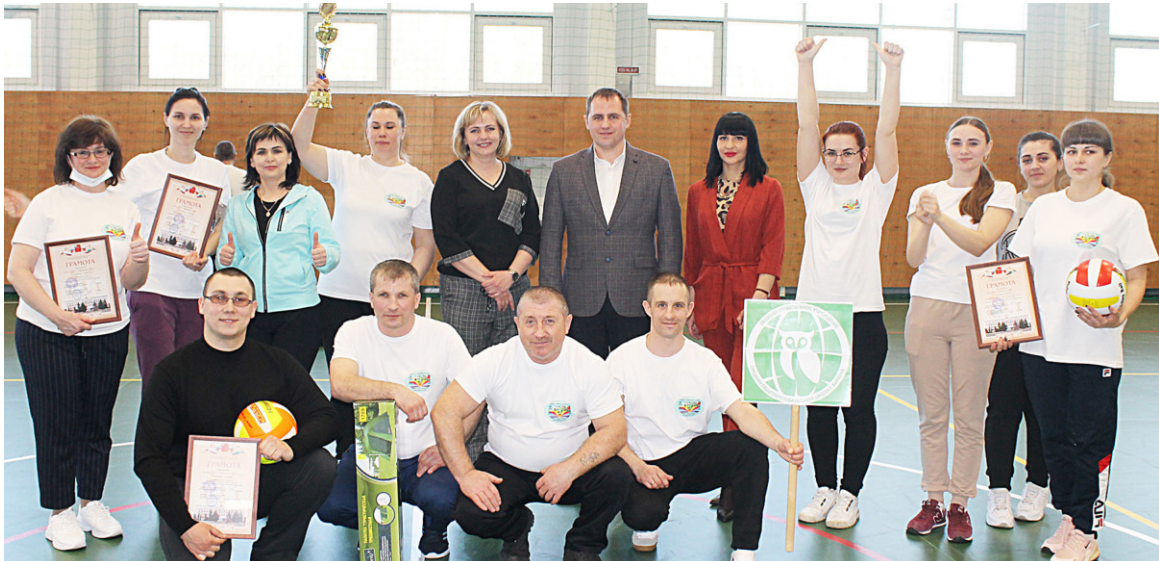
Команда Бирюченской средней школы

Более 250 участников собрали спартакиада образовательных учреждений Красногвардейского района. Основные спортивные баталии развернулись в физкультурно-оздоровительном комплексе «Олимпик» села Никитовка.