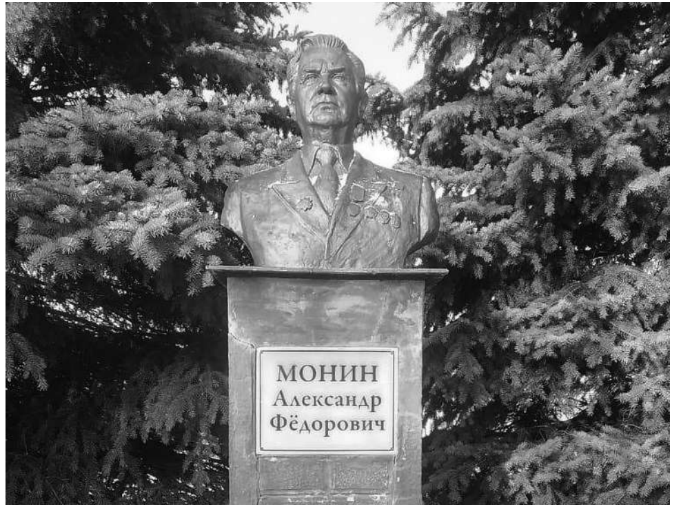
Бюст Александру Фёдоровичу Монину, установленный у административного здания в с. Сорокино