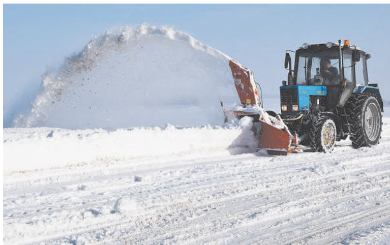
Работает роторный снегоуборщик