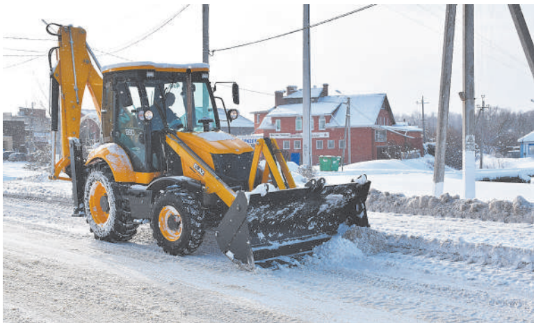
На дороге – экскаватор-погрузчик ELAZ-880