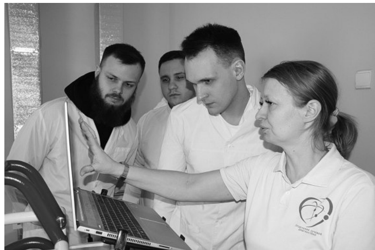
Студенты знакомятся с работой рентгенологической службы