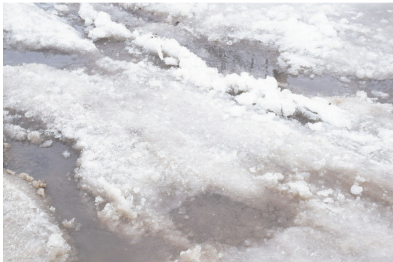
Ручьи по улице Карла Маркса