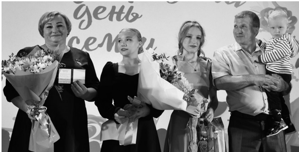
Семья Дворяшиных из г. Бирюч

Торжественное мероприятие, посвящённое Международному дню семьи, прошло в Центре культурного развития «Юбилейный». Четырём жительницам Красногвардейского района были вручены почётные знаки Белгородской области «Материнская слава» третьей степени.