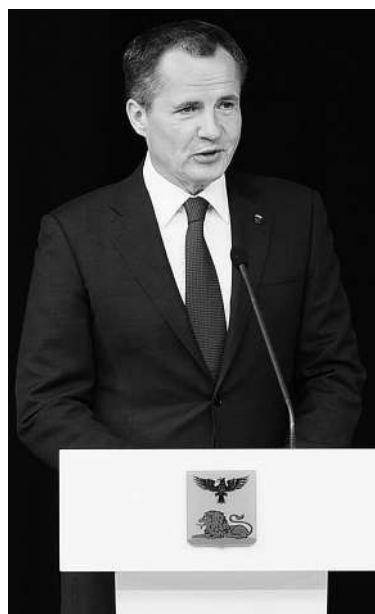
Губернатор Белгородской области Вячеслав Гладков выступил с отчетом перед Белгородской областной думой.

9 июня в культурном центре Белгородского технологического университета имени Шухова состоялось очередное заседание Белгородской областной думы. На нём губернатор представил ежегодный отчет о деятельности правительства региона в 2021 году.