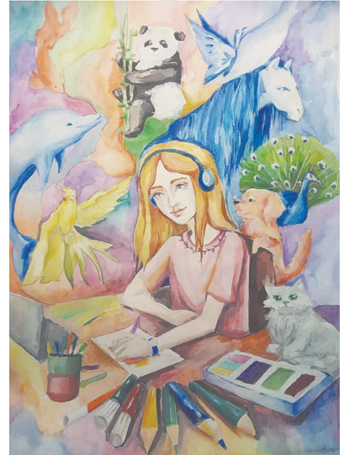
Рисунок Ирины Крысиной «Как прекрасен этот мир»