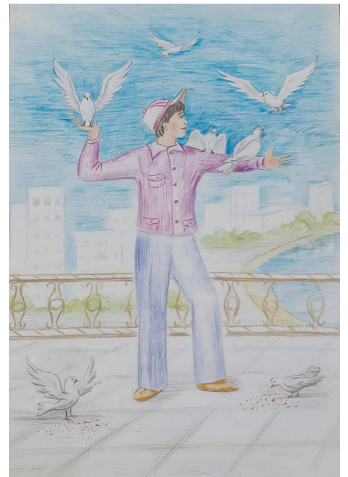
Рисунок Вероники Шевченко, воспитанницы Дома детского творчества