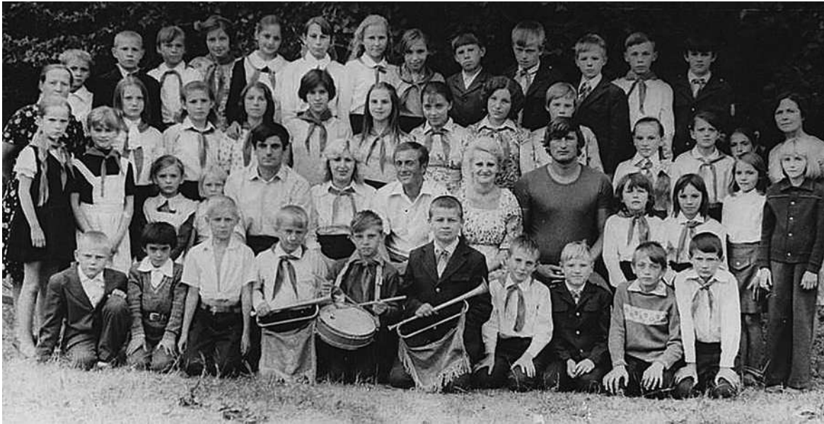
Пионерский лагерь «Лиман», 1979 г.

Пионерия... При упоминании этого слова людям старшего поколения на память приходят прекрасные события детства: сигналы пионерского горна, сборы и слёты, песни у костра, конкурсы, экскурсии и походы, сбор металлолома и макулатуры, военно-спортивная игра «Зарница», юннатское движение.