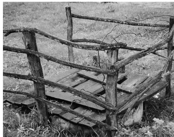
Где-то железобетонные основания и люки ещё не уложены