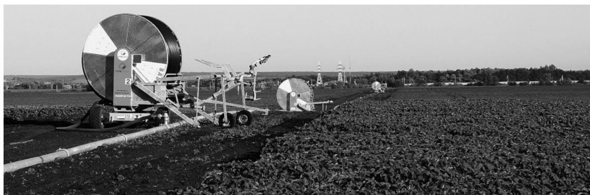
Функционирование системы орошения

ной жизни территорий. В акционерных обществах «Агрокомбинат «Бирюченский», «Самаринское», сельскохозяйственном производственном кооперативе «Большевик», где наращивается поголовье крупного рогатого скота, произошли изменения в структуре посевных площадей в сторону увеличения кормовой группы.