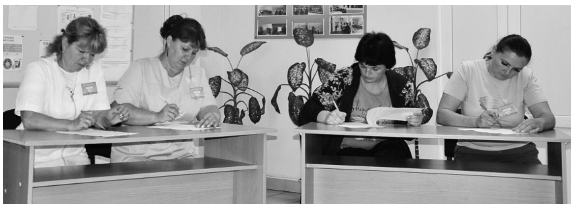
Проверка теоретических знаний