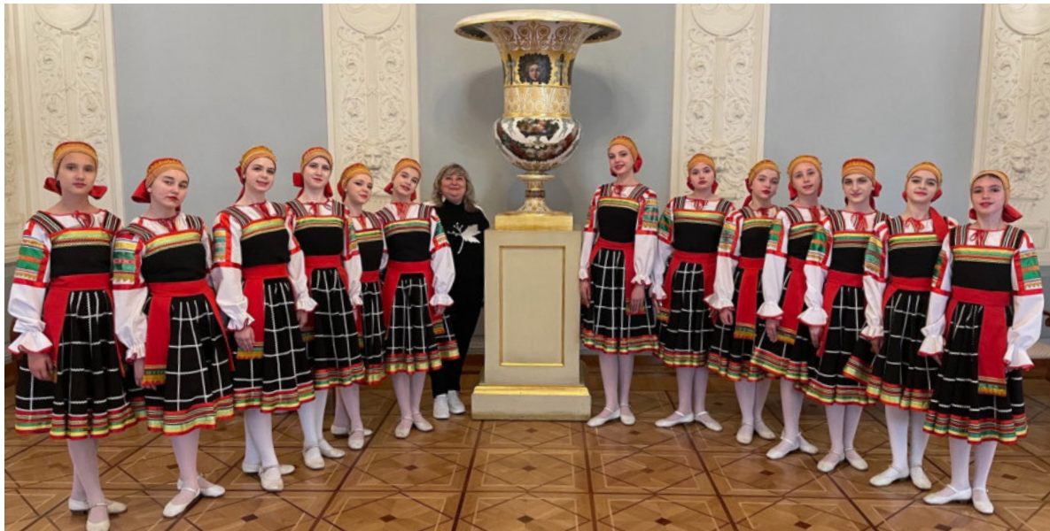
Коллектив «Золотица» достойно представил регион на XXXI Международном фестивале музыки и танца