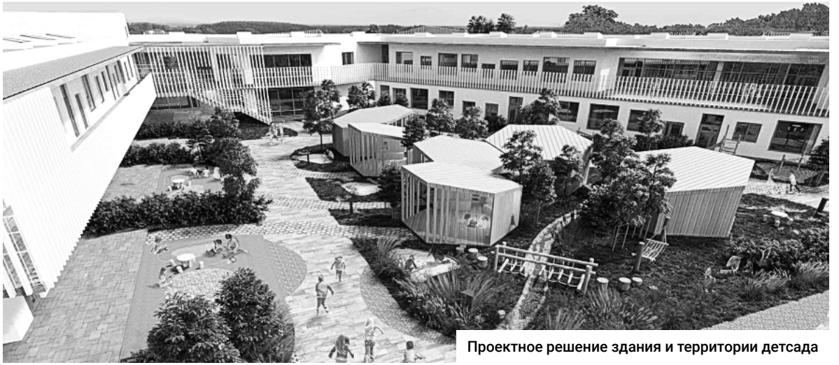
Проектное решение здания и территории детсада