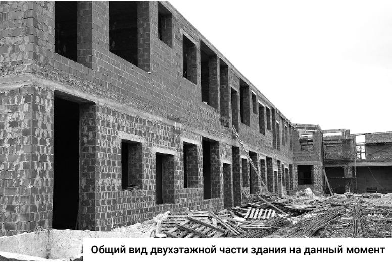
Общий вид двухэтажной части здания на данный момент