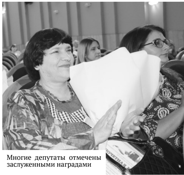
Многие депутаты отмечены заслуженными наградами

На протяжении многих лет большую методическую, консультационную и правовую помощь в деятельности органов местного самоуправления, в частности муниципальных представительных формирований, оказывает ассоциация «Совет муниципальных образований