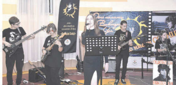
МАТЕРИАЛЫ ПОДГОТОВИЛА ОЛЬГА МУРДАСОВА