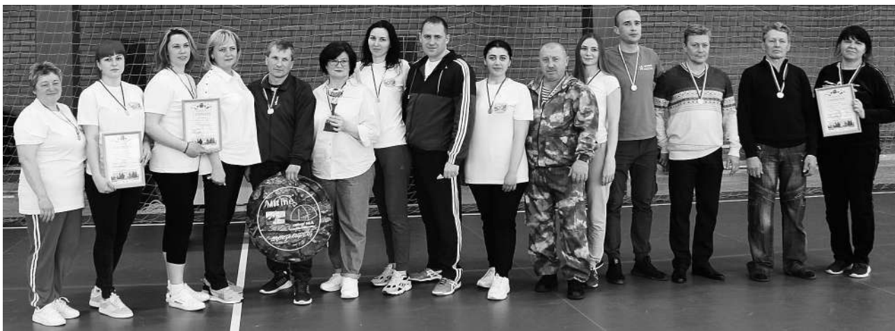
Команда Бирюченской средней школы