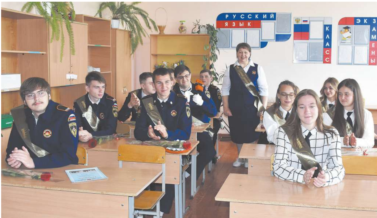
Последний школьный урок для выпускников 11 класса Засосенской средней школы

Последний звонок прозвенел в 26 образовательных учреждениях Красногвардейского района. Он оповестил о завершении 2021–2022 учебного года.