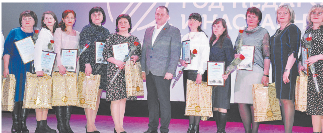
Победители, лауреаты, призёры конкурсов профмастерства