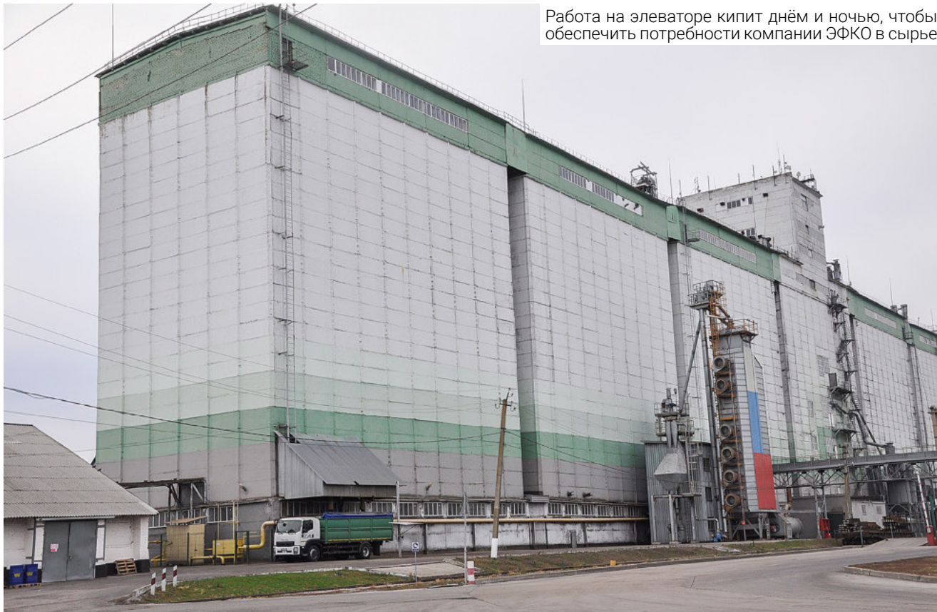
Работа на элеваторе кипит днём и ночью, чтобы обеспечить потребности компании ЭФКО в сырье