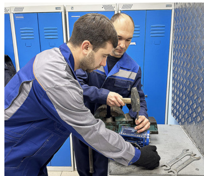
Обслуживание оборудования слесарями ремонтниками

Для тех, кто не боится осваивать новые знания, кото-