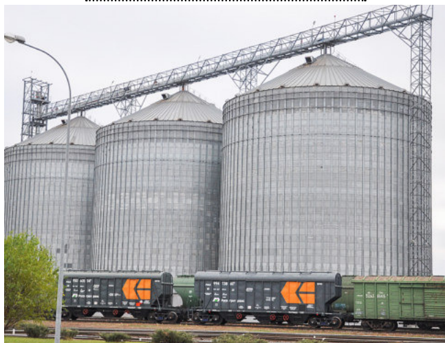
В таких железных ёмкостях хранятся семена сои, которые отправляются на Алексеевский соевый комбинат

Зерновозы с сырьём приезжают на АО «Элеватор» с площадки на месте бывшего аэродрома. Там водители уже прошли регистрацию, сдали пробу на определение качества сырья и, в зависимости от этих показателей, получили распоряжение, на каком участке им разгружаться. Участки отличаются разными мощностями, поэтому сырьё лучшего качества направляется на участок № 2, а то, которое влажнее и грязнее, — на участок № 1.