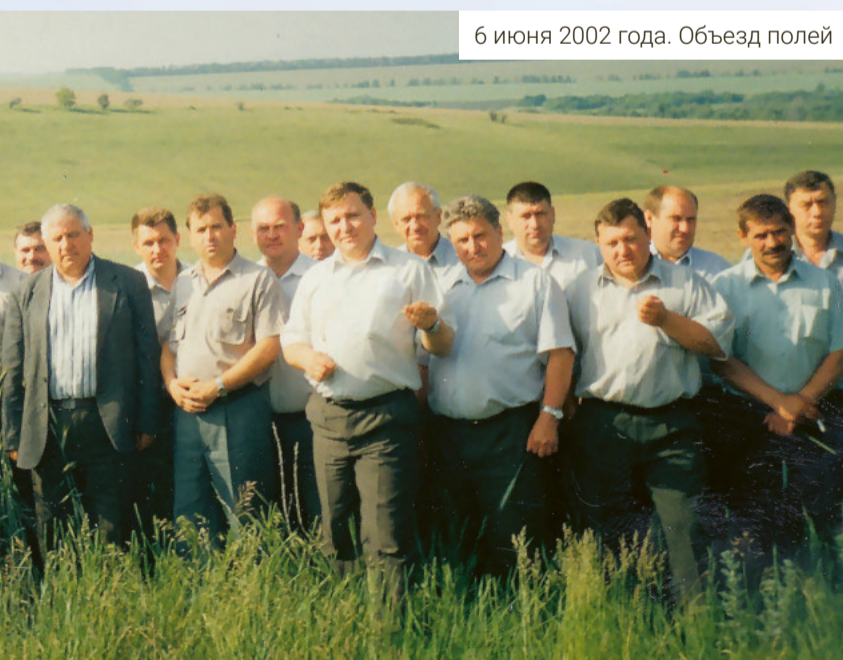
6 июня 2002 года. Объезд полей