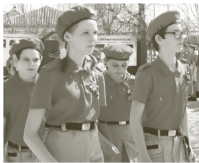
Сорокинская школа приняла Знамя Победы. Событие прошло в торжественной атмосфере.

Патриотическая эстафета «Знамя Победы» продолжила свой путь по муниципальному образованию. Она позволяет отдать дань уважения величайшему подвигу миллионов соотечественников, отстоявших свободу и независимость Родины в годы Великой Отечественной войны.