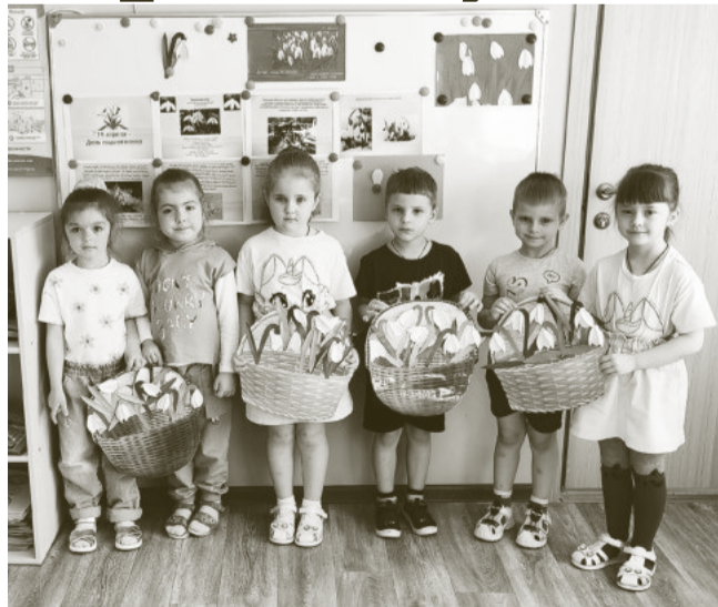
Каждый год, 19 апреля, в нашей стране отмечается чудесный праздник – День подснежника.

Этот день стал символом начала весны, времени, когда природа просыпается от зимнего сна и начинает вновь дарить свою красоту и тепло. Подснежник, этот нежный и хрупкий цветок, становится ярким знаком надежды, силы и обновления.