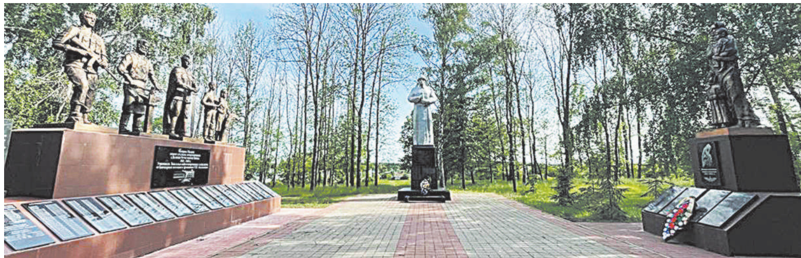
В парке Славы села Большебыково