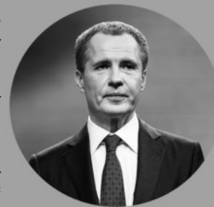
ВЯЧЕСЛАВ ГЛАДКОВ, губернатор Белгородской области (Из отчёта губернатора о работе правительства Белгородской области в 2022 году)

«Все наши действия направлены на то, что несмотря на сложную обстановку, область не должна остановиться в своём развитии. Одним из основных вопросов при докладе президенту была просьба в помощи реализации больших инвестпроектов: от выпуска посевных комплексов до производства активных фармацевтических субстанций, от создания селекционно-генетического центра до инновационного семеноводства, от расширения производства автокомпонентов до производства беспилотных летательных аппаратов. Поддержка есть, объём общих инвестиций составляет порядка 200 млрд рублей».